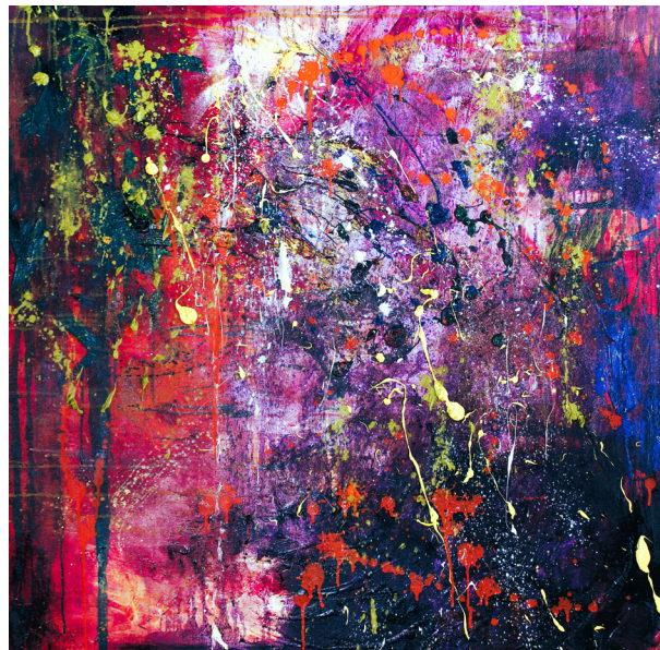
varia frigus (Kalte Farben)

Kleister, Eierschale, Tempera, Aquarell-, Öl- und Acrylfarbe auf Leinwand / Leinölfirnis / 99 x 99 cm (quadratisch) / Signatur: rückseitig (NW) / Hamburg, 2023/01